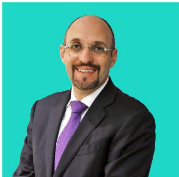
COORDINADO POR: DR. OCTAVIO DE LA TORRE VICEPRESIDENCIA DE LA COORDINACIÓN NACIONAL DE SÍNDICOS DEL CONTRIBUYENTE ANTE AUTORIDADES FISCALES FEDERALES