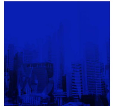
DISEÑADO POR: CORPORATIVO DE TLC ASOCIADOS