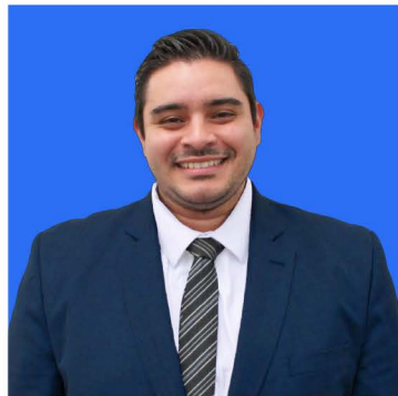
ELABORADO POR: MTRO. MIGUEL ÁNGEL GUILLEN LÍDER DE IMPUESTOS CORPORATIVOS DE TLC ASOCIADOS