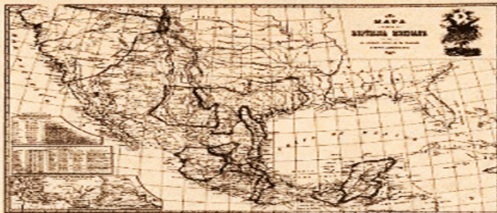
Se han perdido 110 000 leguas cuadradas de territorio

Como indemnización por esas pérdidas territoriales, México re-