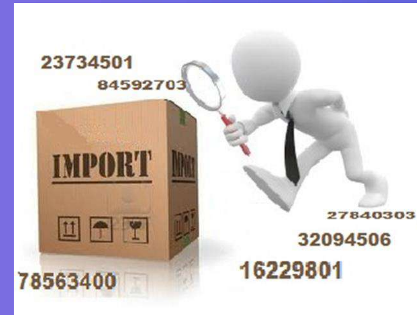
Artículo 20 LCE

En todo caso, las mercancías sujetas a restricciones o regulaciones no arancelarias se identificarán en términos de sus fracciones arancelarias y nomenclatura que les corresponda conforme a la tarifa respectiva.