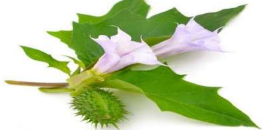
“La Pócima del Amor”