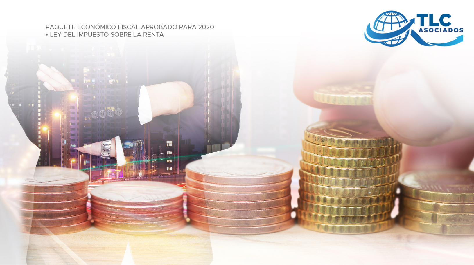
Figura Jurídica Extranjera transparente fiscal