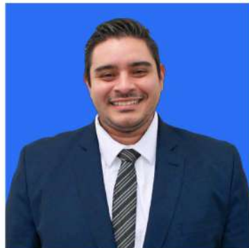
ELABORADO POR: MTRO. MIGUEL ÁNGEL GUILLEN LÍDER DE IMPUESTOS CORPORATIVOS DE TLC ASOCIADOS