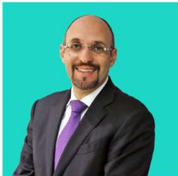
COORDINADO POR: DR. OCTAVIO DE LA TORRE VICEPRESIDENCIA DE LA COORDINACIÓN NACIONAL DE SÍNDICOS DEL CONTRIBUYENTE ANTE AUTORIDADES FISCALES FEDERALES