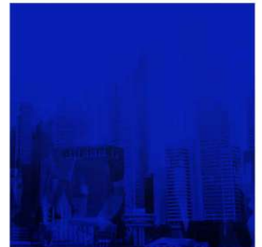
DISEÑADO POR: CORPORATIVO DE TLC ASOCIADOS