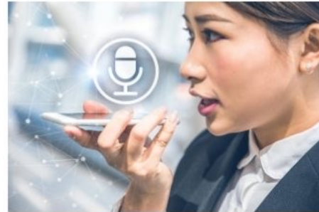
Aplicaciones de traducción