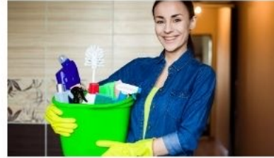
Personal de limpieza