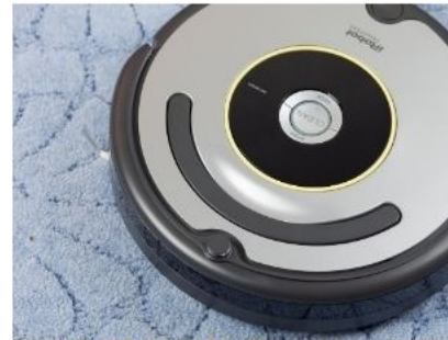
Robot de limpieza