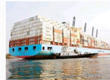
Empresas del programa maquilador de México abusan de las facilidades que tienen para hacer importaciones. /

nufacturera, Maquiladora y de Servicios de Exportación (IMMEX) surgió para impulsar la exportación mexicana ante los competidores globales, por ello, se permite importar insumos, pero con la condición de tener que exportarlos como producto terminado.