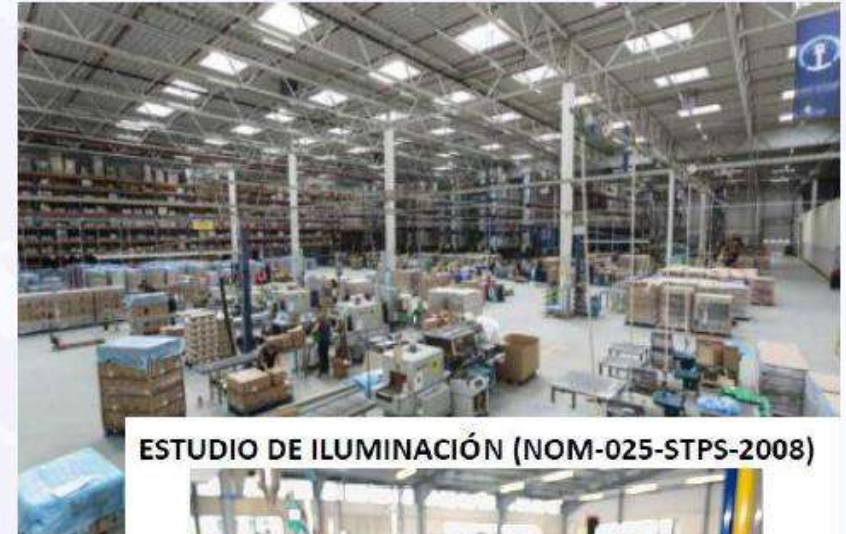
ESTUDIO DE ILUMINACIÓN (NOM-025-STPS-2008)