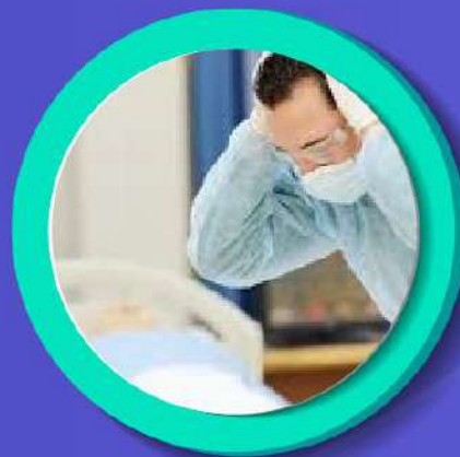
EL HECHO U OMISIÓN ILÍCITO