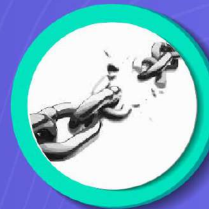
EL NEXO CAUSAL ENTRE EL DAÑO Y EL HECHO U OMISIÓN ILÍCITO