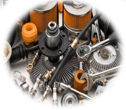
Autopartes para transportes.