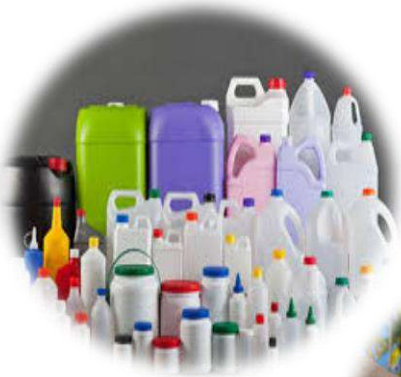
Envases y empaques

ANIEM ASOCIACIÓN NACIONAL DE IMPORTADORES Y EXPORTADORES DE LA REPÚBLICA MEXICANA