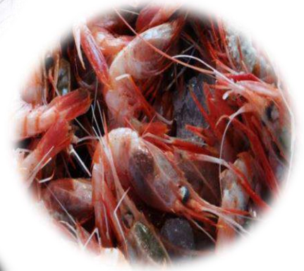
Hidrobiológicos (animales acuáticos para consumo)