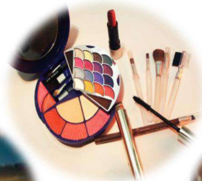
Salud y belleza