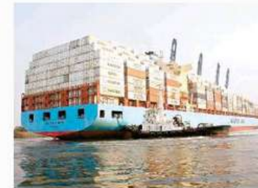
Empresas del programa maquilador de México abusan de las facilidades que tienen para hacer importaciones. /

nufacturera, Maquiladora y de Servicios de Exportación (IMMEX) surgió para impulsar la exportación mexicana ante los competidores globales, por ello, se permite importar insumos, pero con la condición de tener que exportarlos como producto terminado.