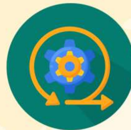
y sus manufacturas