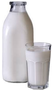
Leche y nata