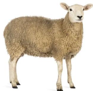
Animales vivos de las especie Ovina