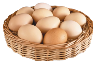
Huevos de ave con cáscara de gallina de la especie Gallus domesticus