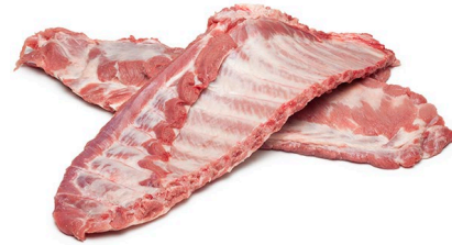
Carne especie porcina , fresca o refrigerada y congelada