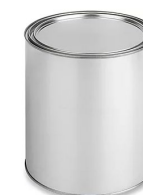
Productos laminados planos de hierro o acero