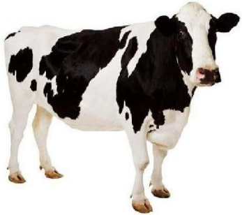
Animales vivos de las especie bovina