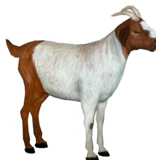
Animales vivos de las especie Caprina