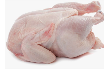
Carne y despojos comestibles, de aves