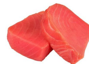
Filetes congelados Atunes (del género Thunnus),