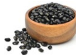
Frijoles, ciertas especies Vigna mungo (L) Hepper o Vigna radiata (L) Wilczek