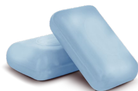
Jabón de tocador, excepto medicinales