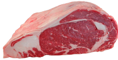
Carne especie bovina , fresca o refrigerada y congelada