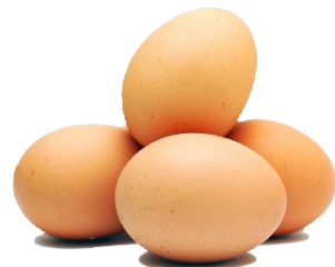
Huevos de ave