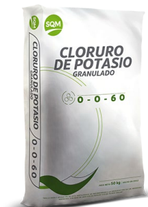
Cloruro de potasio