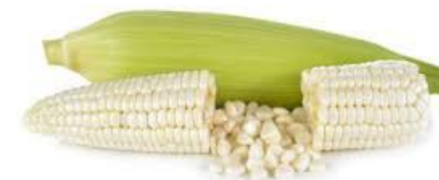
Maíz blanco (harinero)