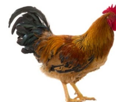
Aves de la especie Gallus domesticus