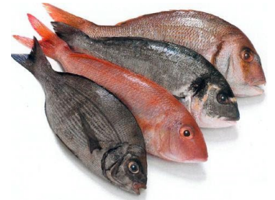
Pescado fresco o refrigerado y congelado