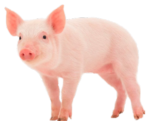
Animales vivos de las especie Porcina