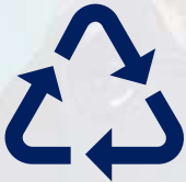
Desperdicios de metal